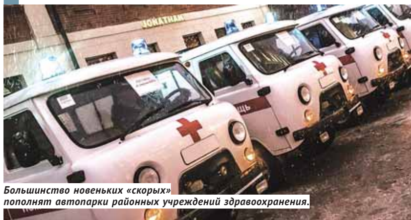
Большинство новеньких «скорых» пополнят автопарки районных учреждений здравоохранения.

Хорошим новогодним подарком для медиков области стали 20 новых «скорых», ключи от которых главврачам больниц 26 декабря вручил врио губернатора Андрей Травников.