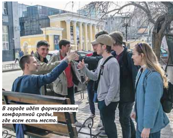
В городе идёт формирование комфортной среды, где всем есть место.

регулярно проводят бесплатные мастер-классы для начинающих велосипедистов: учат вождению, разъясняют ПДД. И активно лоббируют реализацию 3-этапного развития велосипедной инфраструктуры в Новосибирске: создание пилотного участка для велосипедного движения на одной из улиц (ул. Ленина) и создание двух уровней сетей велодорожек в Академгородке в рамках проектов