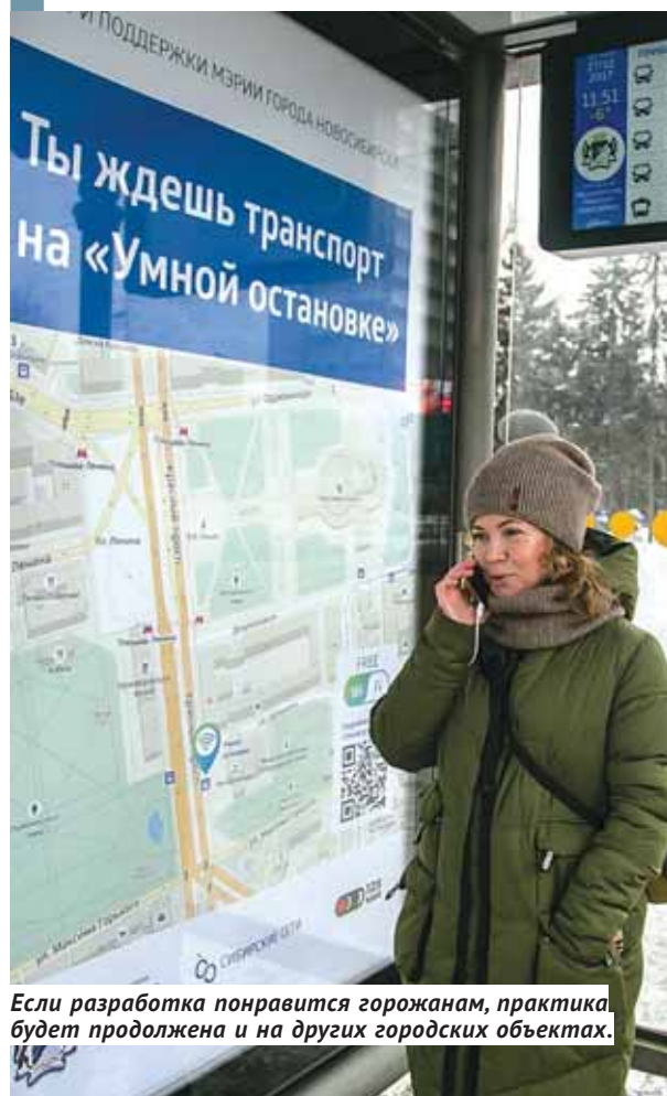
Если разработка понравится горожанам, практика будет продолжена и на других городских объектах.

В Новосибирске открылась первая «умная» остановка. Новый павильон с интеллектуальной начинкой обустроен на остановке общественного транспорта «Дом Ленина». Это экспериментальная площадка, где внедряет свою разработку крымская компания «Городские инновации СПб». Со своим проектом она познакомилась новосибирцев в апреле на форуме «Городские технологии». Идея была поддержана. Ноу-хау крымского предприятия уже работают в Санкт-Петербурге, Севастополе и других городах страны.