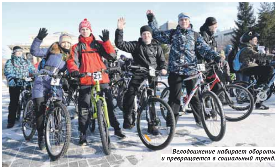
Велодвижение набирает обороты и превращается в социальный тренд.

Социальные тренды сегодня в тренде: создаются новые общественные движения, разрабатываются интересные проекты, жители городов выходят в публичное пространство со своими идеями и предложениями. Новосибирск эта мода тоже не обошла стороной.