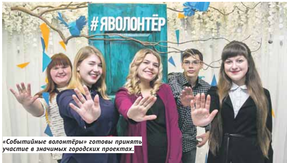
«Событийные волонтеры» готовы принять участие в значимых городских проектах.

нечем было кормить — в больнице не было детского питания. Мне стало очень странно: как так? Столько взрослых людей и не могут накормить детей?