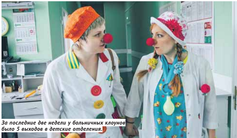
За последние две недели у больничных клоунов было 5 выходов в детские отделения.