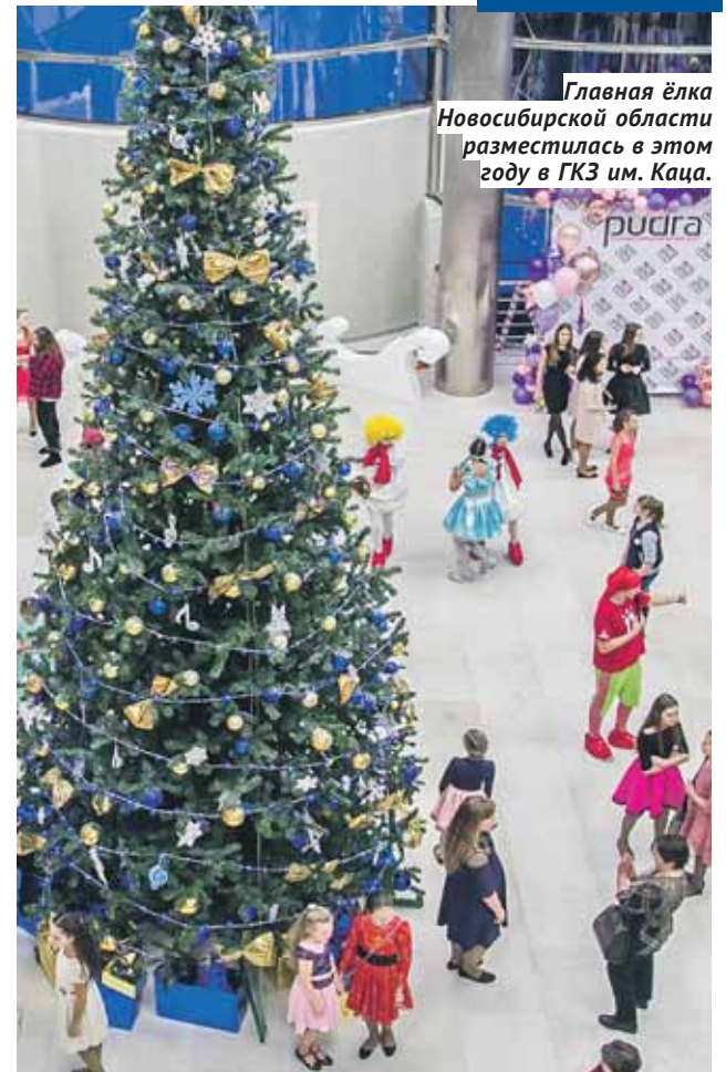
Главная ёлка Новосибирской области разместилась в этом году в ГКЗ им. Каца.