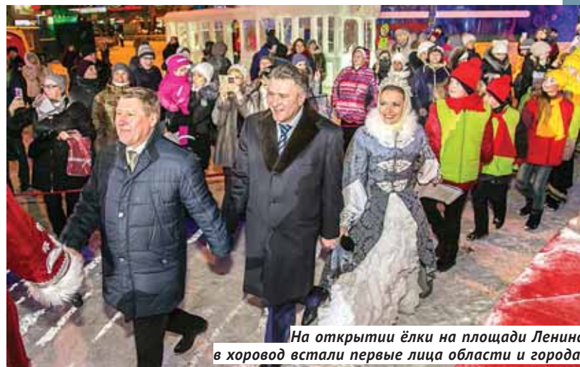
На открытии ёлки на площади Ленина в хоровод встали первые лица области и города.

Все праздничные дни на площади Ленина будет проходить программа для детей с участием Деда Мороза. 31 де-